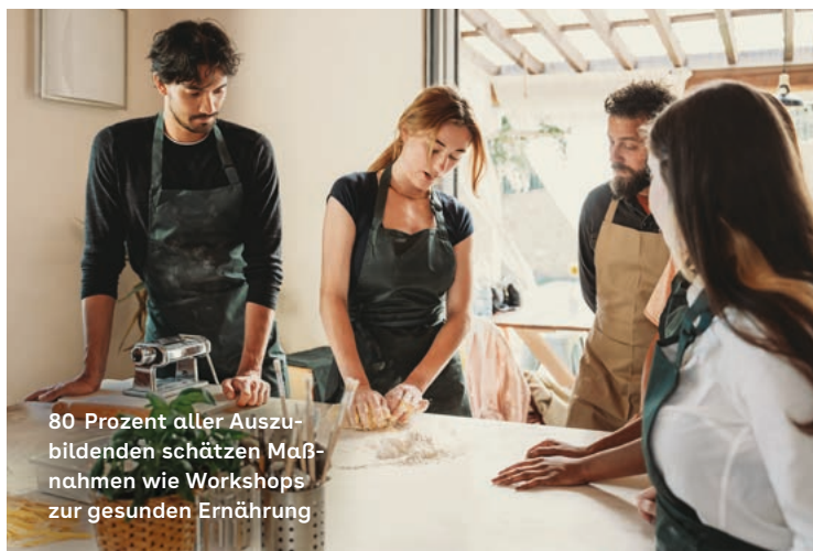
80 Prozent aller Auszubildenden schätzen Maßnahmen wie Workshops zur gesunden Ernährung

Auszubildenden und gemeinsame Aktivitäten wie etwa Teamevents punkten. Diese tragen zur Stärkung der Identifikation mit dem Betrieb und der Belegschaft bei. Auch die Einbindung in Entscheidungsprozesse ist in kleinen Unternehmen meist besser und einfacher möglich als in größeren Betrieben. ◦