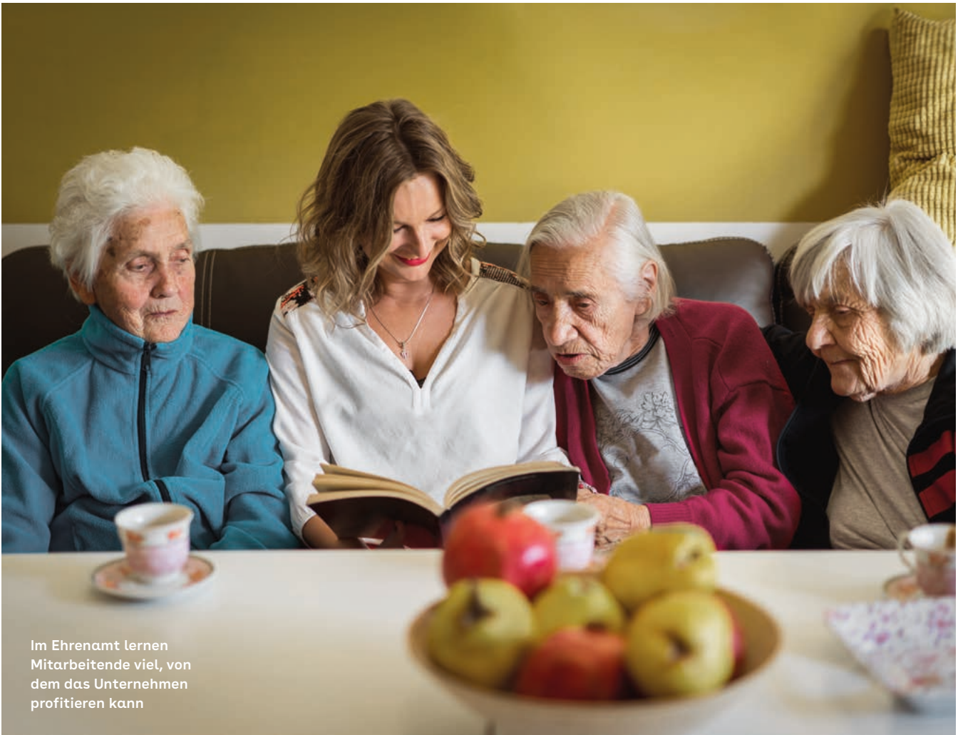
Im Ehrenamt lernen Mitarbeitende viel, von dem das Unternehmen profitieren kann